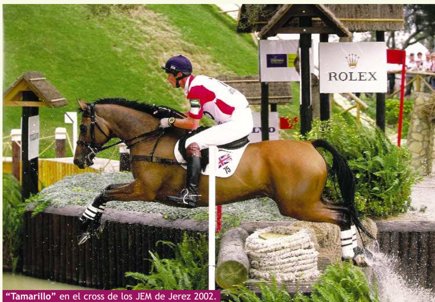
“Tamarillo” en el cross de los JEM de Jerez 2002.